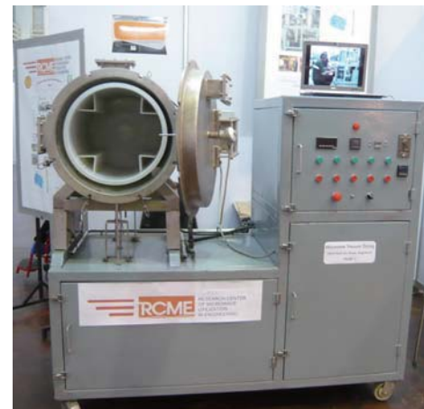
งานวิจัยและพัฒนากระบวนการบำบัดของเนกประสงค์เชิงพาณิชย์โดยใช้ไมโครเวฟร่วมระบบสุญญากาศ